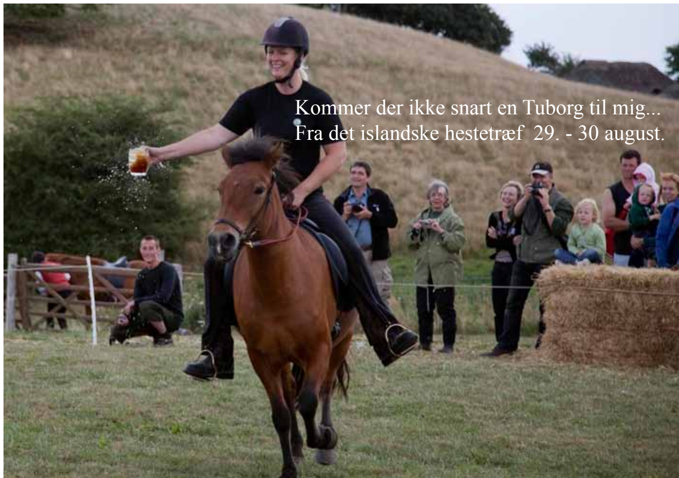
Kommer der ikke snart en Tuborg til mig... Fra det islandske hestetæf 29. - 30 august.