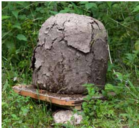
Lerklædt halmkube af tysk model, som skal benyttes i Sagnlandets historiske biavl

Idéen til "Bier på spil" opstod som et resultat af Naturvejlederens ønske om både at danne et naturvejlederlaug i Sagnlandet, men også at udbrede kendskabet til den