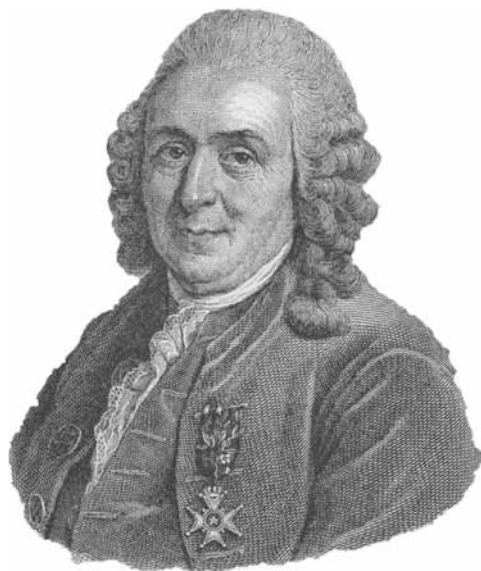
Carl von Linné 1707 -1778