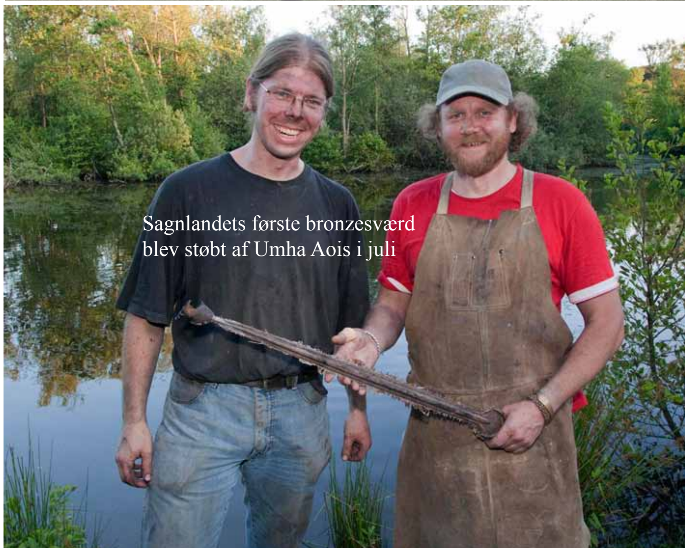
Sagnlandets første bronzesværd blev støbt af Umha Aois i juli