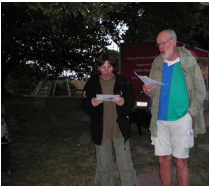
De knap så små synger under årsfesten.

Uden jeres frivillige og engagerede hjælp, var der ingen fest. Så en stor tak fra alle os andre for jeres engagement, der sikrede alle en rigtig dejlig og stemningsfuld oplevelse denne smukke augustaften.