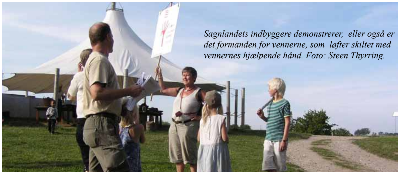
Sagnlandets indbyggere demonstrerer, eller også er det formanden for vennerne, som løfter skiltet med vennernes hjælpende hånd.