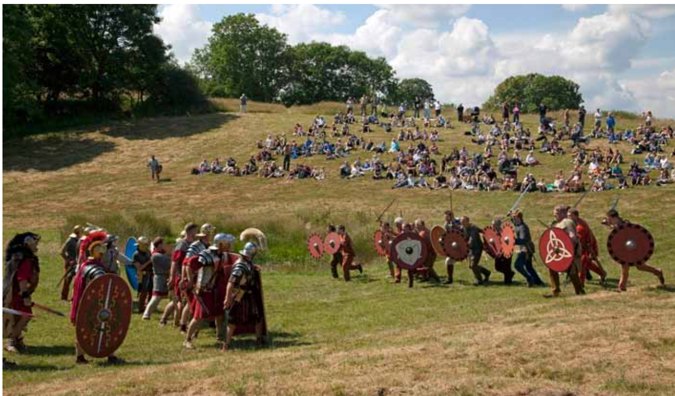
Prindsens Hverving gør udfald mod Cohors Cimbria til publikums store begejstring.

På de næste sider kan I læse mere om vennernes oplevelser som frivillig under Varus og de tabte legioner.